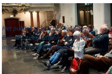
Het publiek tijdens de studiedag Deinstitutionalization: the Dutch way? in de Geertekerk in Utrecht.